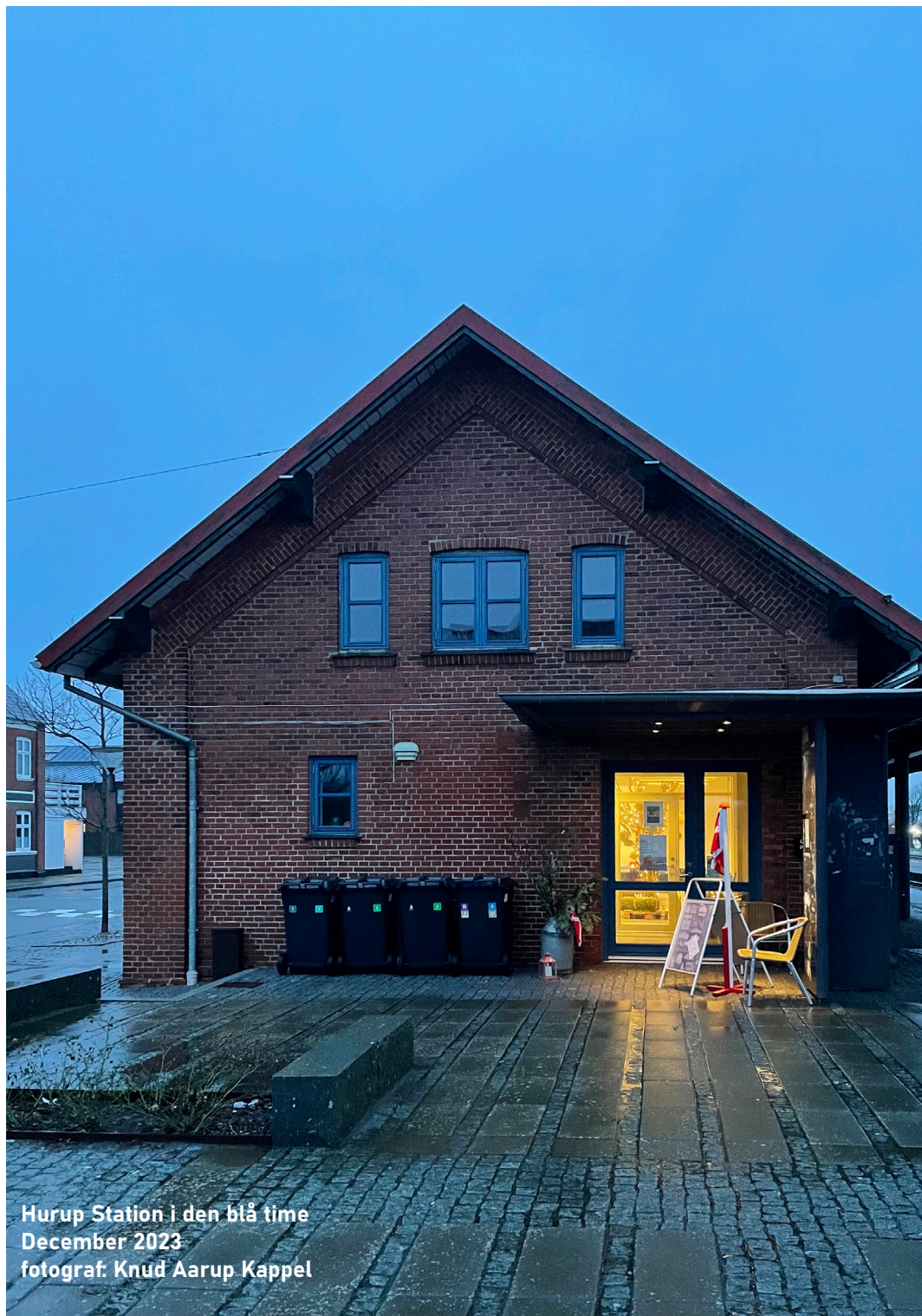
Hurup Station i den blå time December 2023

Realdania har i 2023 annonceret en ny pulje, øremærket midler til bymidteudvikling i mindre byer med oplandsfunktion. Puljen er rettet mod byer med 4-20.000 indbyggere og har fokus på kvaliteten i bymidterne med fokus på bygningsbevaring, bygningsaktivering, byens rum, fællesskaber og bedre sammenhænge i lokalmiljøet. Puljen er som skabt til Byklyngen Hurup Thys arbejde. Vi har været i dialog med Realdania – der også har overværet præsentationen af projektet på Byplanmødet i Aarhus i oktober – og der er god interesse for at samarbejde om projektet. Da Hurup er under 4000 indbyggere, men har vigtig oplandsfunktion for et større område, og projektets niveau, lokale forankring og strategiske styrke i øvrigt, meddeler Realdania at projektet er relevant og at interessen er gensidig. I Byklyngen Hurup