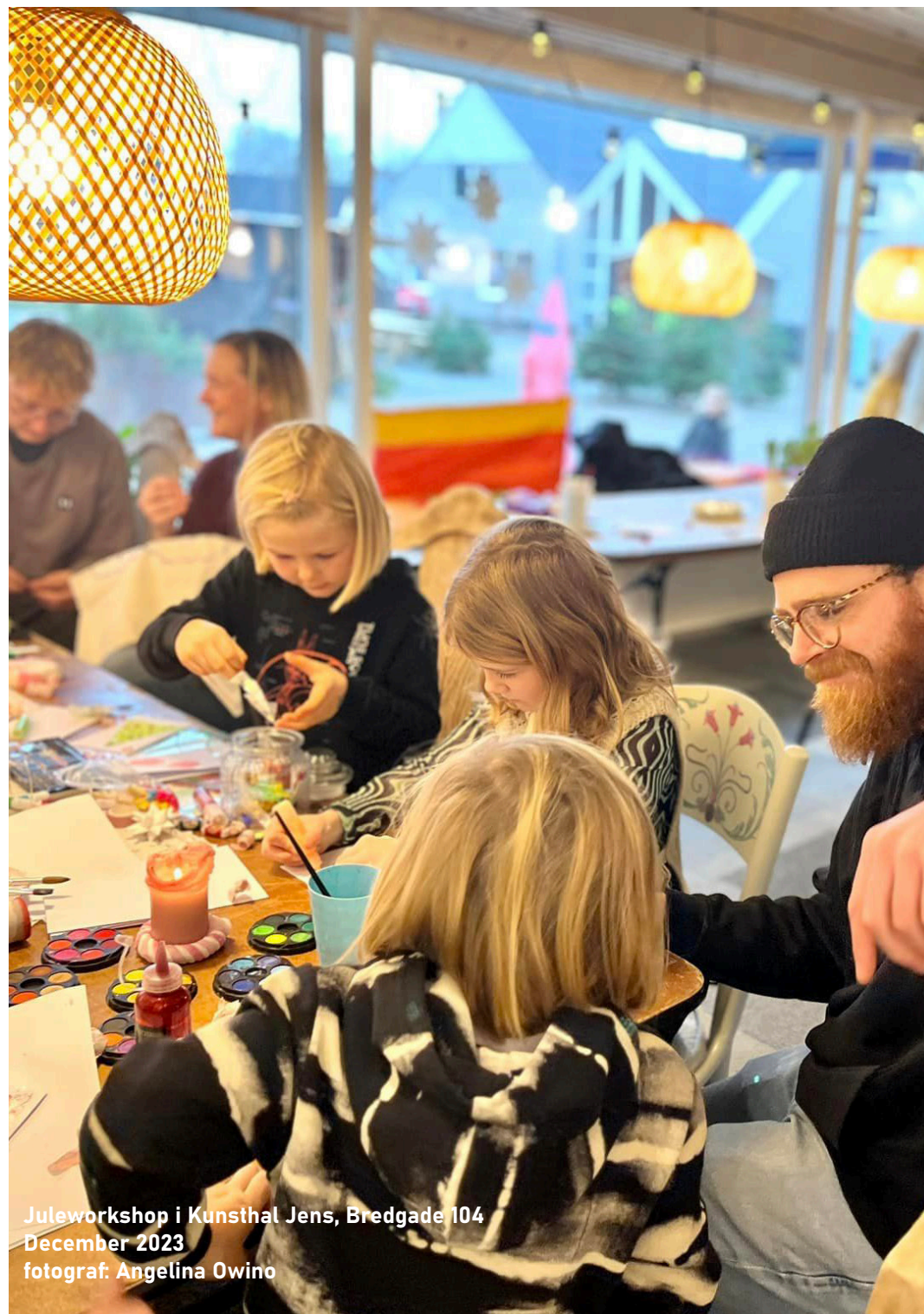
Juleworkshop i Kunsthal Jens, Bredgade 104 December 2023

På workshopsne arbejdes og tænkes på tværs mellem forskellige interesser og projektengagementer og der opstår en god synergi mellem byudviklingsinitiativerne. Forankringen lokalt (projektejer) samt